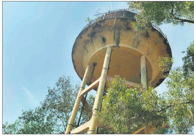
अनुपयोगी पानी टंकी।

इस भीषण गर्मी के बीच नगर पंचायत प्रतापपुर के वार्ड नंबर 7 में पेयजल संकट ने विकराल रूप ले लिया है। पिछले पांच दिनों से वार्डवासी बूंद-बूंद पानी के लिए तरस रहे हैं। हालात ऐसे हैं कि महिलाएं, बच्चे और बुजुर्ग सभी को रोजमर्रा की जरूरतों के लिए भारी परेशानी का सामना करना पड़ रहा है। एक ओर छत्तीसगढ़ शासन घर-घर नल-जल योजना के